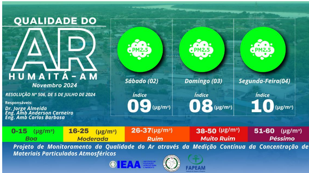
Figura 2 – Nível de qualidade do ar baseado nas coletas feitas pela estação de monitoramento ECOPM do IEAA/UFAM.