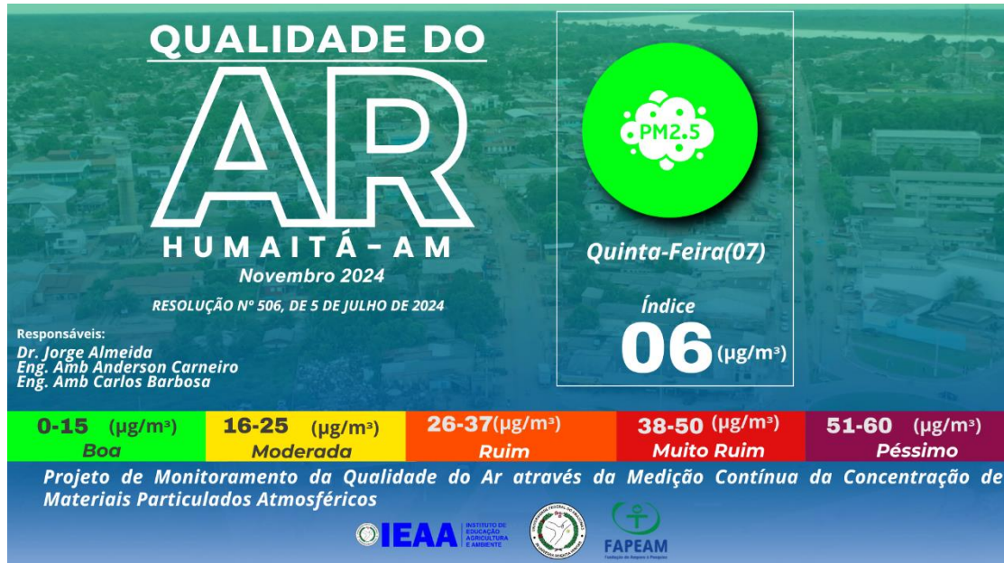
Figura 2 – Nível de qualidade do ar baseado nas coletas feitas pela estação de monitoramento ECOPM do IEAA/UFAM.