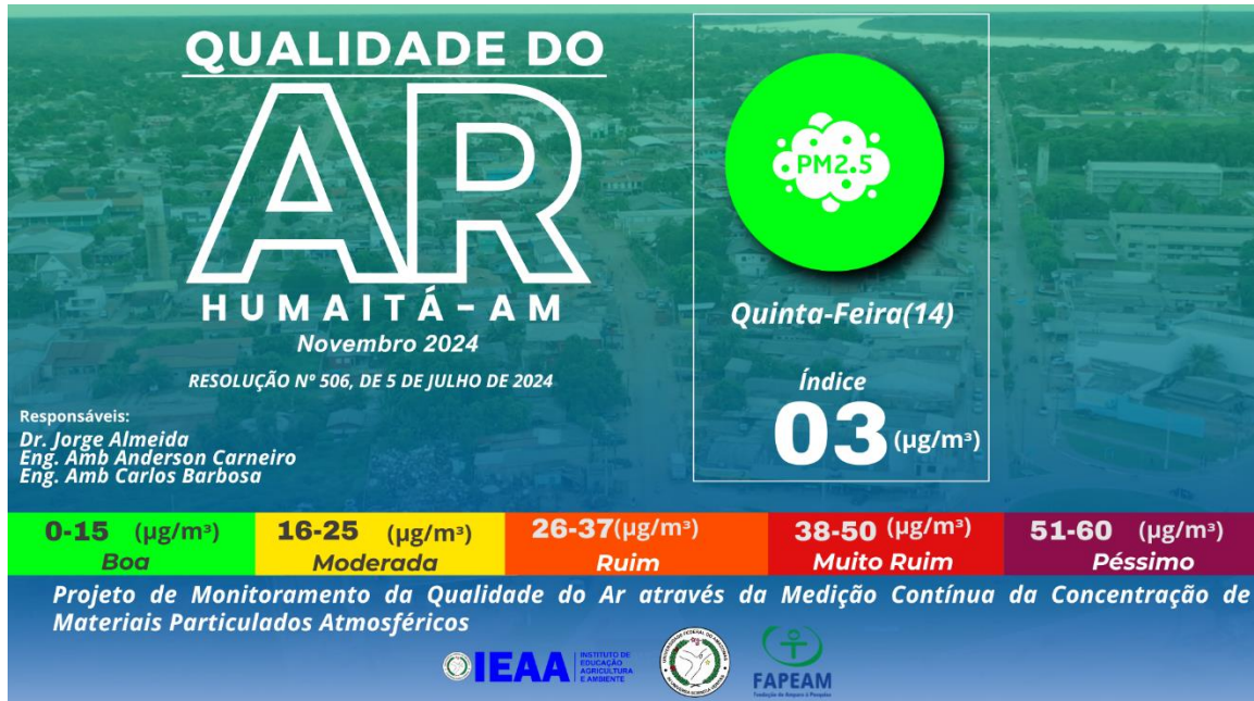
Figura 2 – Nível de qualidade do ar baseado nas coletas feitas pela estação de monitoramento ECOPM do IEAA/UFAM.