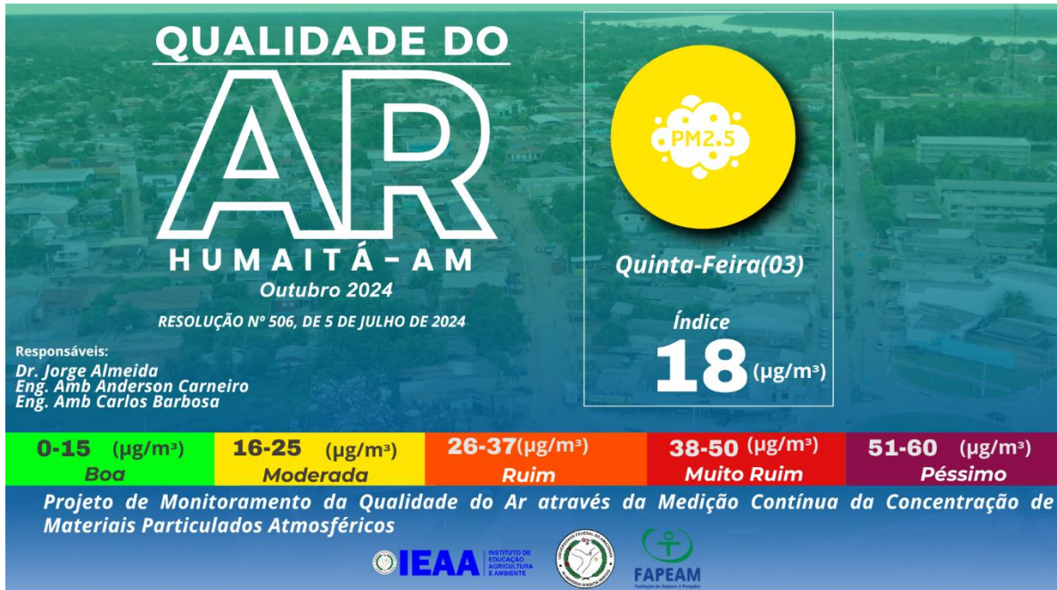
Figura 2 – Nível de qualidade do ar baseado nas coletas feitas pela estação de monitoramento ECOPM do IEAA/UFAM.