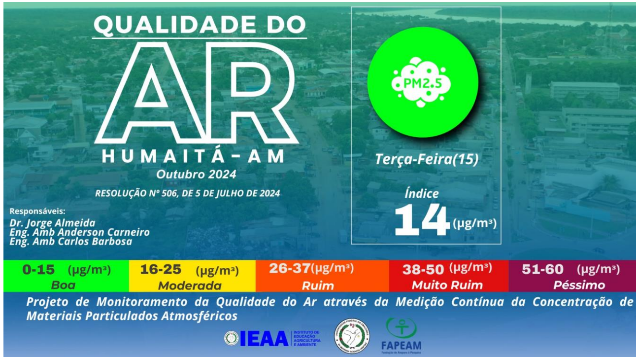
Figura 2 – Nível de qualidade do ar baseado nas coletas feitas pela estação de monitoramento ECOPM do IEAA/UFAM.