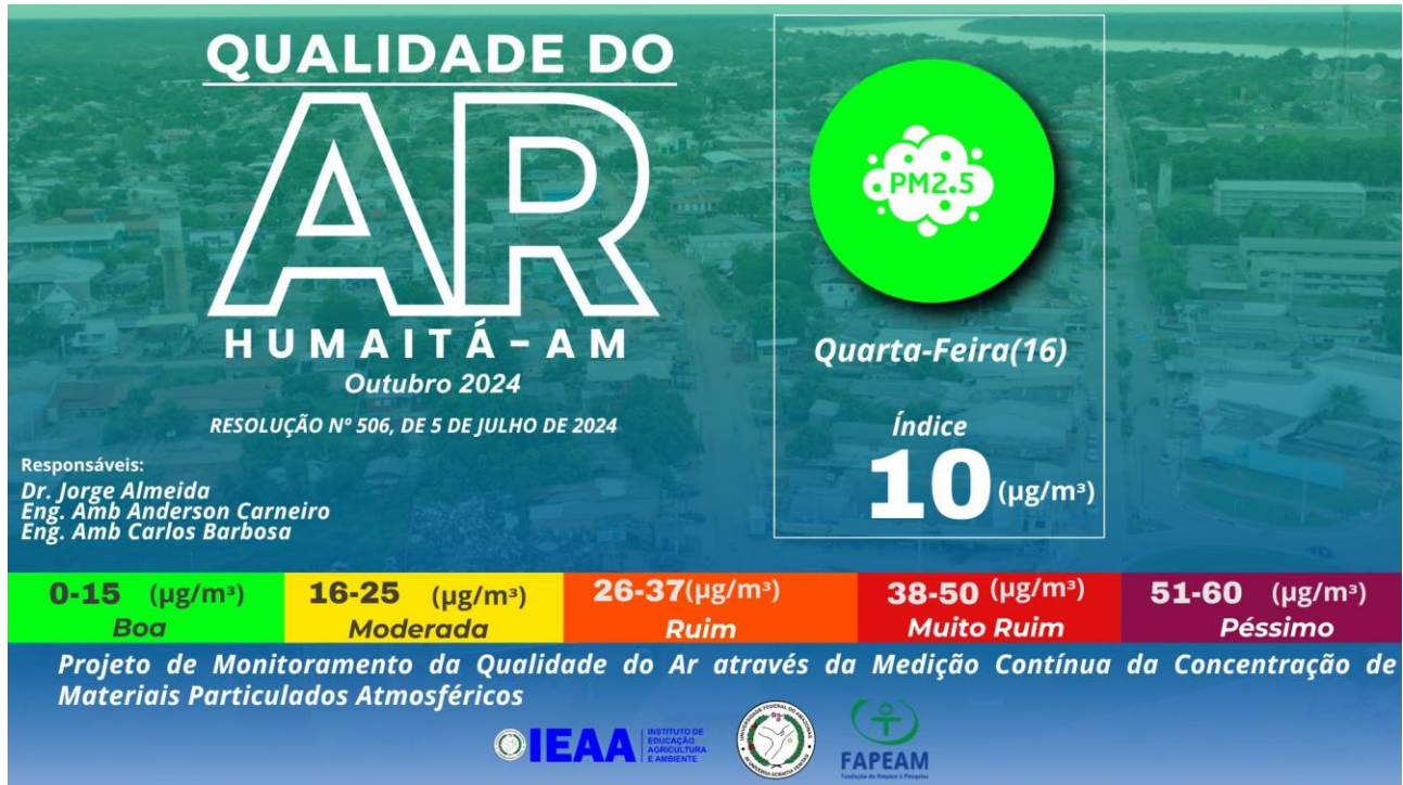
Figura 2 – Nível de qualidade do ar baseado nas coletas feitas pela estação de monitoramento ECOPM do IEAA/UFAM.